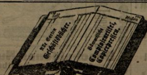
Extragutachten und Formate in kürzester Zeit.