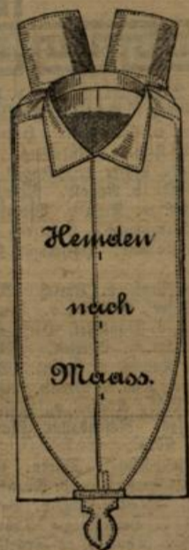
Herren- nach Maass.

Vorräthige Herren-Hemden à Mk. 2.50, Mk. 3.50, Mk. 4.50, grösste Auswahl in Herrenkragen u. Manschetten neuester Formen.