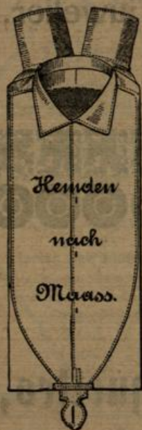
Vorräthige Herren-Hemden à Mk. 2.50, Mk. 3.50, Mk. 4.50, grösste Auswahl in Herrenkragen u. Manschetten neuester Formen.