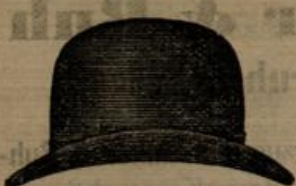
Steifer neuester Herrenhut, farbig und schwarz, von M. 2.50 an.