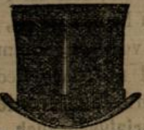
Seidenhut mit Carton von M. 4.50 an.

Herren- u. Knaben-Filzhüte in nur gediegener Waare zu den allerbilligsten Preisen.