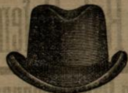
Welcher moderner Herrenhut in allen Farben von M. 2.50 an.