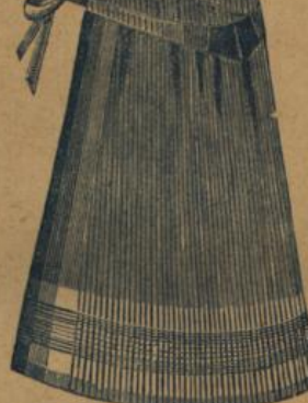
No. 553. Hausstandsschürze aus abgepasst. Baumwollstoff und mit Miedergurt M. 1.10