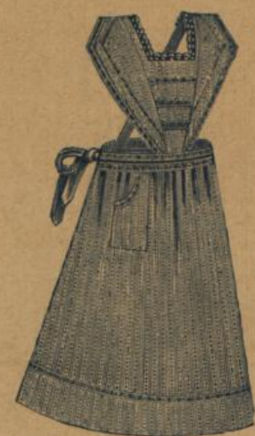
No. 541. Feine Hausstandsschürze mit Latz, Träger, Waschbesatz und Tasche M. 1.80