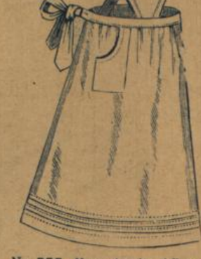
No. 555. Hausstandsschürze, weiss Baumwollstoff m. Latz und reicher Stickerei M. 2.20