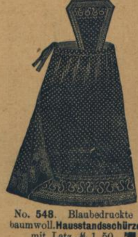
No. 548. Blauegedruckte baumwoll. Hausstandsschürze mit Latz M. 1.50