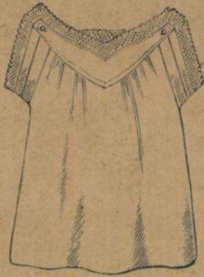
No. 578. Kinderhemd, 50 cm Achselchl. m. Herzpasse, guter mittelfädiger Cretonne mit dreifacher Zacksenpitze garnirt 60 ⚡