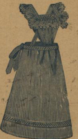
No. 543. Gestr. Hausstandsschürze mit Gallonbesatz und languettirt. Kragen M. 1.25