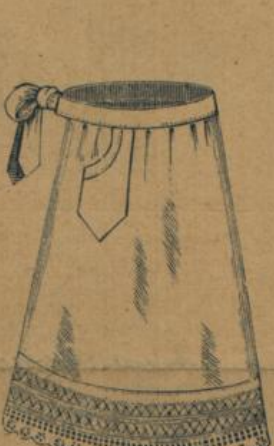
No. 559. Weiss Hausstandsschürze mit Tasche und breiter Spitzenborde M. 2.25