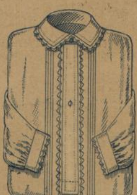
No. 602. Damen-Nachthemd. Elsässer Hemdentuch, feinfädig, vorzügliche Qualität mit la. Madeira Handstickerei ausgestattet. Besonders zu empfehlen wegen der gediegenen Ausführung 1.50