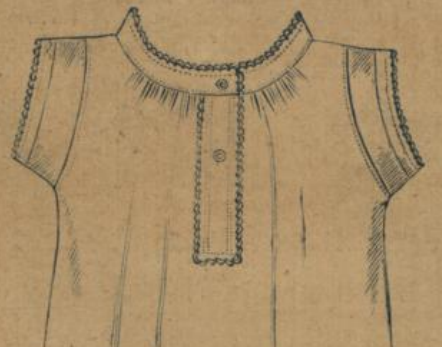
No. 586. Damenhemd. Vorderschluss, mittelfädiger Cretonne mit Handlanguette. Sehr vortheilhaft und besonders zu empfehlen 1.70