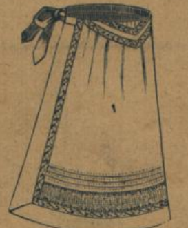
No. 564. Tüfelschürze aus weiss Nansoo mit bedruckter Waschborde und Hohlsaum M. 1.50