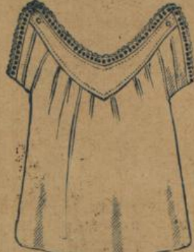
No. 580. Kinderhemd, 45 cm Achselchluss mit Herzpasse, guter mittelfädiger Cretonne mit Stickereiansatz 60 ⚡