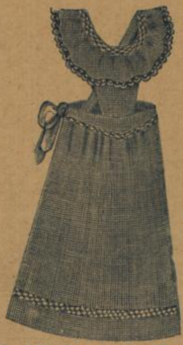
No. 537. Hausstandsschürze mit Miedergurt, Latz, Träger und Festonbesatz 90 A