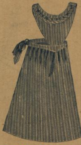
No. 545. Einfache Hausstandsschürze aus blauestr. Gingham m. Latz u. Miedergurt M. 1.20