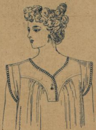
No. 589. Damenhemd. Herzpassenform, vorne geschlossen, mittelfädiger Cretonne, sehr schöne Qualität mit gutem Feston garnirt 1.25