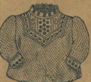
No. 571. Kinderjäckchen aus weiss gerauhtem Piqué mit reich gesticktem Einsatz 80 A