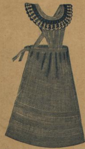
No. 546. Hausstandsschürze aus melirt. Baumwollstoff mit gestr. Borden und besticktem Träger 75 A