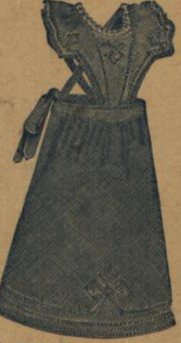
No. 544. Extragrosse Hausstandsschürze mit reichem Waschbesatz und Feston M. 3.—