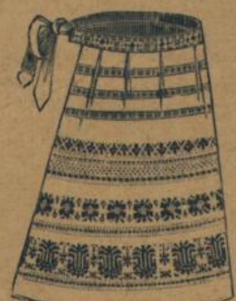
No. 565. Altdeutsche Zierschürze, sehr vorteilhaft 50 A