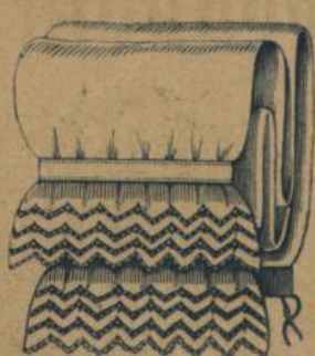
No. 609. Damen-Beinkleid. la. Renforce, feinfädig, geschmackvolle gute Stickerei 1.20