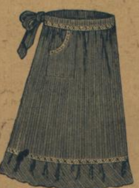
No. 550. Hausstandsschürze mit Miedergurt, Tasche und Falle M. 1.20