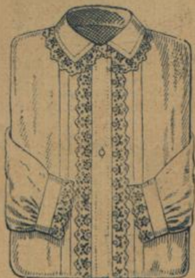
No. 600. Damen-Nachthemd. Feinfädiger Hemdentuch mit Umlegkragen, hübsche Stickereigarnitur 1.30