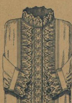
No. 603. Damen-Nachthemd. la. Renforce, feinfädige Qualität mit Zwischensatz und an beiden Seiten Jabot aus reicher, guter Stickerei, sehr effectreiche Ausführung 1.50

Form mit 5 Knöpfchern geschlossen. 35—60 cm für 1—12jährige Kinder