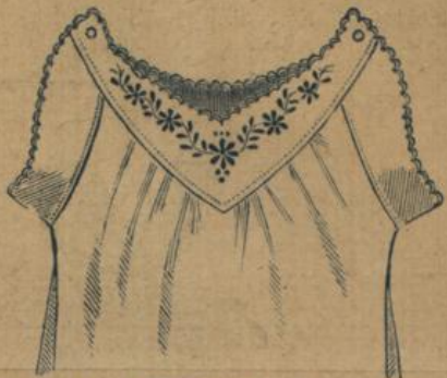
No. 594. Damenhemd. Achselchlussform mit handgestickter Herzpasse und handlanguettert, weiche, eleg. Qualität Hemdentuch, alles in bester Madeira Handarbeit 1.40