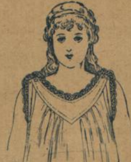
No. 581. Kinderhemd, 50 cm Achselchluss mit Herzpasse, guter mittelfädiger Cretonne mit hübscher Barmer Spitze 70 ⚡