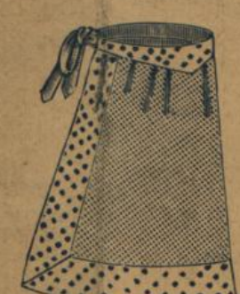
No. 568. Zierschürze aus bedrucktem Cretonne 30 A