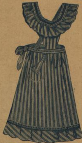
No. 539. Hausstandsschürze aus kräft. Baumwollstoff mit Glanz, Latz u. Träger M. 1.80