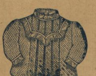
No. 576. Kinderjäckchen aus weiss gerauhtem, gemustertem Piqué mit Spitzenbesatz 58 A