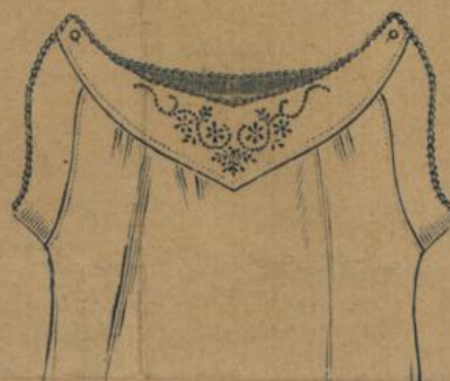
No. 596. Damenhemd. Achselchlussform mit handgestickter Herzpasse und handlanguettert, weiche, elegante Qualität Hemdentuch, reicher Ausführung, alles in bester Madeira Handarbeit 1.50