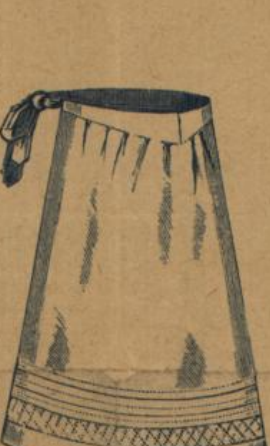
No. 561. Weiss grosse Hausstandsschürze mit Hohlsaum M. 1.25