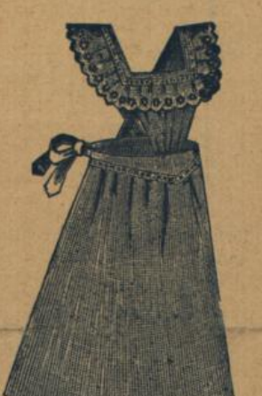
No. 563. Kinderschürze 50 cm aus hellbedrucktem Waschstoff mit besticktem Kragen und Träger M. 1.20