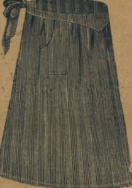
No. 551. Hausstandsschürze mit Miedergurt und Tasche M. 1.40