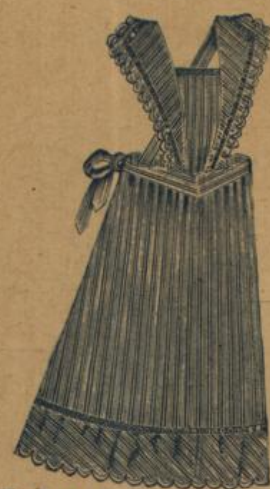
No. 540. Feine Hausstandsschürze aus kräftig. gestreift Baumwollstoff mit languett. Falle M. 1.50