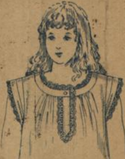
No. 579. Kinderhemd, 60 cm Bündchenform, gute mittelfädige Qualität mit hübscher Barmer Spitze verziert 80 ⚡