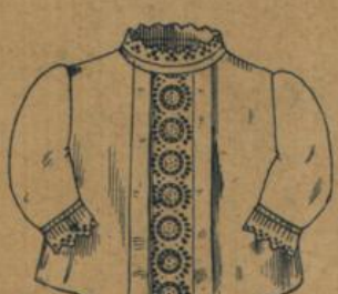
No. 573. Kinderjäckchen aus weiss gerauhtem Croisé mit gesticktem Revers 80 A