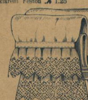
No. 612. Damen-Beinkleid. Kräftiger Cretonne mit breiter schöner Stickerei 1.25