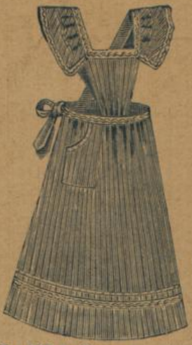
No. 536 A. Grosse complete Hausstandsschürze mit Latz, Träger u. Waschgalonbesatz a. kräft. gestreift. Ginghamstoff M. 1.75