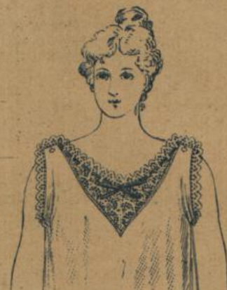
No. 591. Damenhemd. Feinfädiger Cretonne, Plattstück aus Stickerei-Einsatz mit Seidenbändchen durchgezogen 1.30