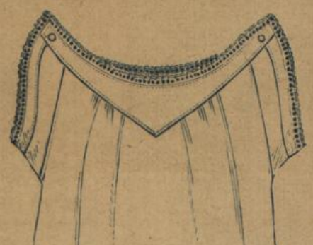
No. 587. Damenhemd. Achselchlussform mit Herzpasse, mittelfädiger Hemdentuch mit Stickereiansatz 1.70