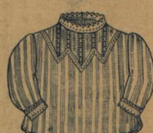
No. 575. Kinderjäckchen aus weiss gestreiftem Batist mit Stickerei 60 A