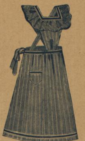
No. 542. Blau gestreifte Hausstandsschürze mit Latz, Träger und Tasche M. 1.40