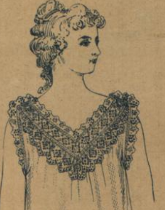
No. 593. Damenhemd. Fantasie-Form mit feinfädiger Hemdentuch mit Stickerei reich garnirt 1.75