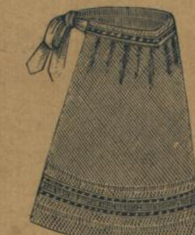
No. 566. Modefarbige Zierschürze, Nattestoff mit türkischer Borde M. 1.10