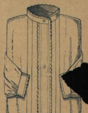
No. 599. Damen-Nachthemd. Feinfädiges Hemdentuch mit Bogenfeston in einfach, guter Ausführung, sehr preiswerth 1.20