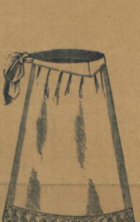
No. 560. Weiss Hausstandsschürze mit Miedergurt und Festonstickerei M. 1.50