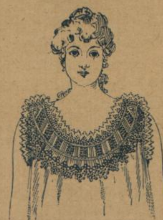
No. 598. Damenhemd. la. feinfädiger Renforce, beste Qualität, reich garnirt mit feinsten Schweizer Stickereien, hocheleg. verarbeitet 1.75