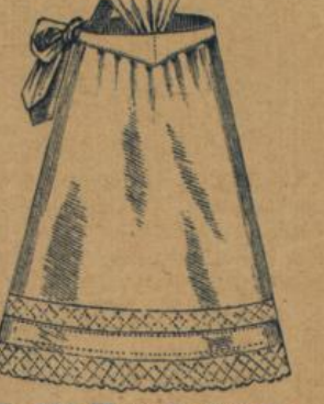
No. 556. Weiss Hausstandsschürze aus kräft. Baumwollstoff, Miedergurt, Latz, Träger mit Zwischenbesatz und Spitze M. 2.—