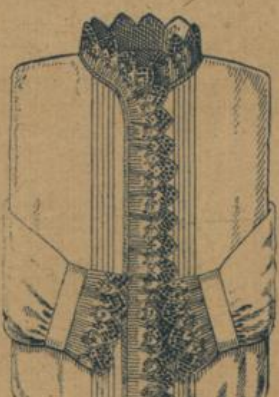
No. 601. Damen-Nachthemd. Feinfädiges Hemdentuch mit Jabot von hübscher, breiter Stickerei, beiderseits mit kleinen Fältchen abgeknöpft 1.40