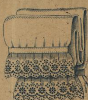
No. 610. Damen-Beinkleid. Mittelfädiges, kräftiges Hemdentuch, schönes, ausdrucksvolles Dessin der Stickerei 1.20