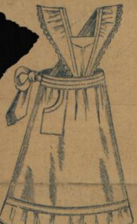
No. 557. Weiss Hausstandsschürze aus weiss. Hemdentuch mit Spitzenbesatz und Tasche M. 2.25