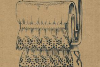
No. 607. Damen-Beinkleid. Dickfädiger Cretonne mit breiter, billiger Stickerei. Einfachste Ausführung 1.10