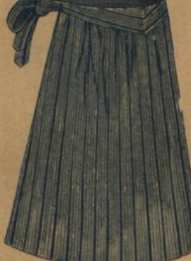
No. 554. Extraweite Hausstandsschürze, gestreift, mit Miedergurt M. 1.50