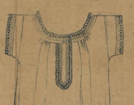
No. 585. Damenhemd. Bündchenform mittelfädiger Hemdentuch mit hübscher Stickerei garnirt 1.70