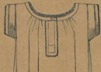
No. 592. Damenhemd. Eleganter, mittelfädiger Cretonne, geschlossene Waare mit la. Madeira Handlanguette, gediegene beste Arbeit 1.25