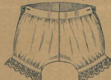
No. 604. Kinderhose. Mittelkräftig Hemdentuch mit Stickerei, klares Muster 43 ⚡

Form mit 5 Knöpfchern geschlossen. 35—60 cm für 1—12jährige Kinder