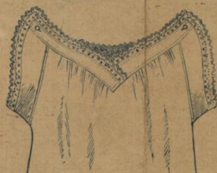
No. 590. Damenhemd. Hübsche, neue Form, Achselchluss, la. Hemdentuch mit guter effectreicher Stickerei 1.30