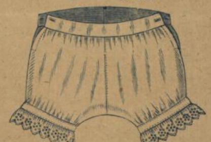
No. 605. Kinderhose. Mittelfädiger Cretonne mit Stickerei, mattes Dessin 75 ⚡