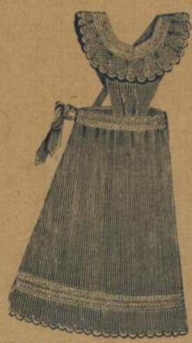
No. 538. Gestr. Hausstandsschürze mit Latz u. languett Kragen M. 1.50