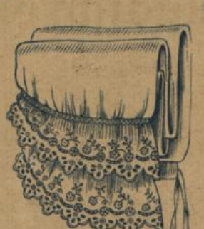
No. 611. Damen-Beinkleid. Neueste Form, sogen. Kniefacon, feinfädiger Hemdentuch, effectvolle breite Stickerei 1.90