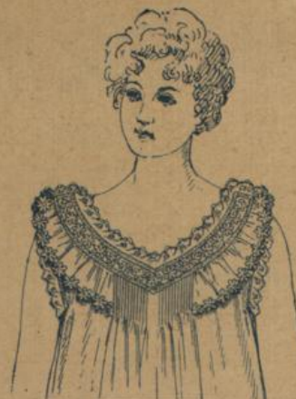
No. 597. Damenhemd. Renforce feinfädigste Waare mit la. Schweizer Feston u. Zwischensatz, vorne in schmalen Fältchen abgenäht, eleg. Ausführung 1.50