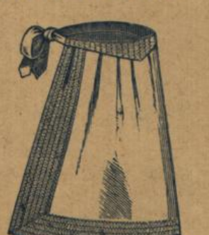
No. 570. Zierschürze aus weiss Croisé mit farbig bedruckter Cretonneborde 32 A