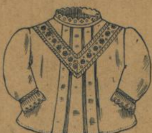
No. 572. Kinderjäckchen aus weiss gerauhtem Croisé mit gesticktem Zwischenbesatz M. 1.—