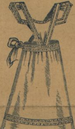
No. 558. Weiss Hausstandsschürze mit farbigem Waschbesatz, Latz und Träger M. 1.50