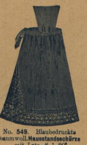
No. 549. Blauegedruckte baumwoll. Hausstandsschürze mit Latz M. 1.20