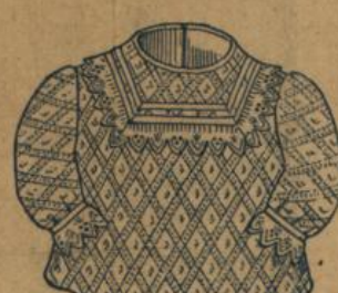
No. 574. Kinderjäckchen aus weiss gerauhtem, gemustertem Piqué mit Stickerei 40 A