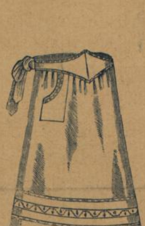
No. 562. Weiss Hausstandsschürze mit Miedergurt und farbigem Waschborde M. 1.60