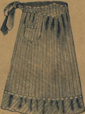
No. 552. Hausstandsschürze aus hell. bedruck. Baumwollstoff mit Miedergurt, Waschbesatz und Falle M. 1.25