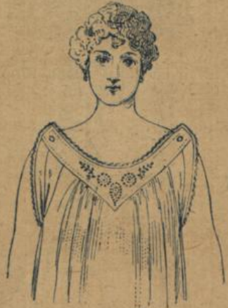
No. 588. Damenhemd. Achselchlussform, feinfädiger Hemdentuch mit handgestickter Passe, sehr empfehlenswerth 1.20