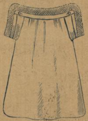
No. 577. Kinderhemd, 45 cm Achselchluss aus mittelfädiger Cretonne mit Spitze 40 ⚡

Sämmtliche Kinderhemden in den Grössen von 35—60 cm resp. für 1—12jährige Kinder.