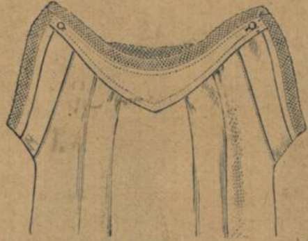
No. 583. Damenhemd. Achselchlussform mit Herzpasse, mittelfädiger Hemdentuch mit Trimmingansatz 1.50