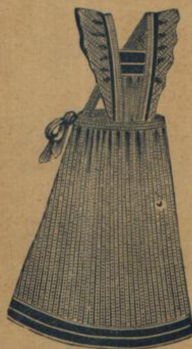
No. 547. Hausstandsschürze aus kräft. Baumwollstoff mit dunkelblauem Besatz M. 2.25