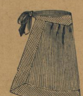
No. 569. Zierschürze aus gestreiftem Mull mit bedrucktem Cretonnebesatz 60 A