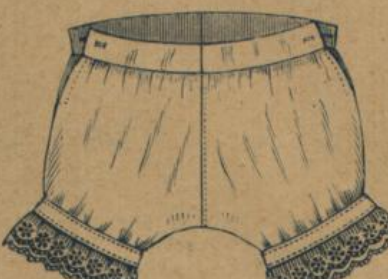
No. 606. Kinderhose. Gerahmt Croisén mit gutem, klarem Feston 1.25