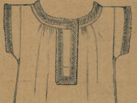
No. 582. Damenhemd. Bündchenform mit Spitze, dickfädige Waare, billige Ausführung 1.10