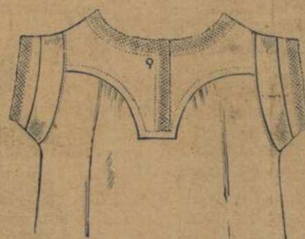
No. 584. Damenhemd. Koller- od. Sattel-Facon, mittelfädiger Hemdentuch mit Barmer Spitze besetzt 1.60