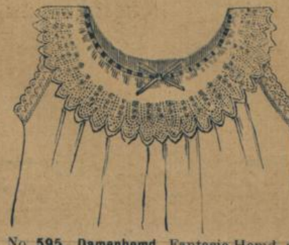
No. 595. Damenhemd. Fantasie-Hemd, an der Achsel geknöpft, beste Fabrikat Renforce, feinfädige, geschmeidige Waare mit Volant, aus feiner, reicher Stickerei und mit Zwischensatz und Seidenbändchen garnirt 1.50