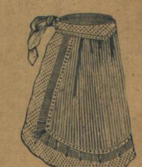
No. 567. Zierschürze aus weiss gestreiftem Mull mit hellbedruckter Waschborde 90 A