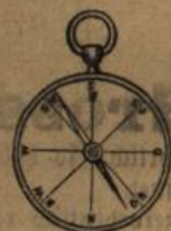
Compass, Höhenmess- und Taschen-Barometer, Schrittzähler.

Druck und Verlag des G. v. Müller'schen Hofbuchhandlung, redigirt unter Verantwortlichkeit von Ludwig Negele in Karlsruhe.