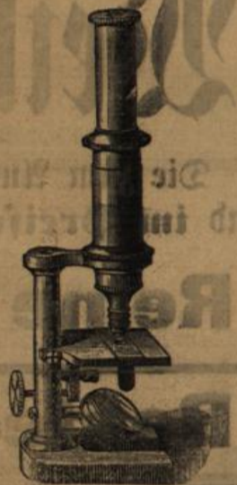
Schüler- u. grössere Mikroskope, Loupen.

Die in illustr. Preislisten und sonst von auswärts angebotenen Instrumente können von mir in gleichen Qualitäten 5—20% billiger bezogen werden.