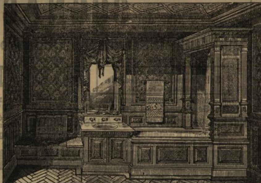
Feine Bad- und Toilette-Einrichtung.