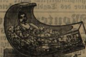
Wellenbadschaukeln (Dittmann's) Patent.