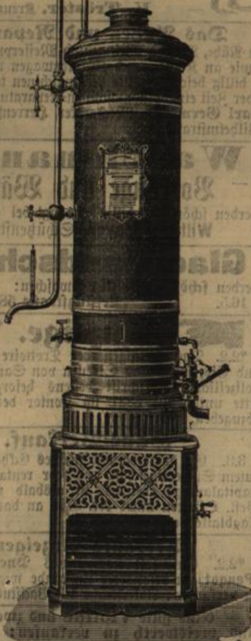
Vaillant's pat. Gasbadofen ist der beste.