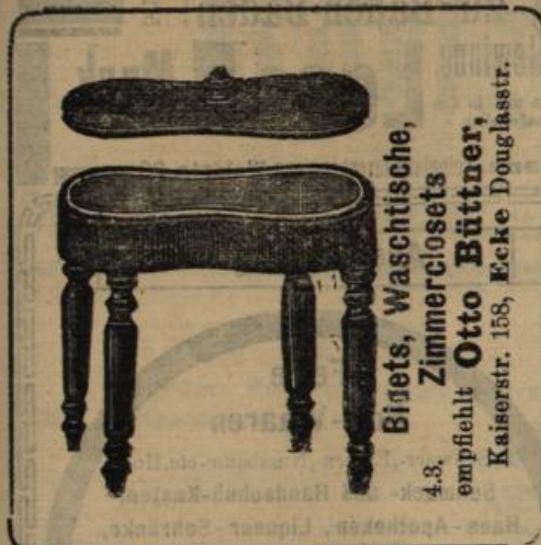
Bigets, Waschtische, Zimmerclosets empfiehlt Otto Büttner , Kaiserstr. 158, Ecke Douglassstr.

Christbaumständer, Schlittschuhe, Schlitten, Laubsägen, Drillbohrer, Laubsägen garnituren, Fleischhackmaschinen, Mandelreiber, Kaffeemühlen, Wärmeflaschen, Tischbestecke, Tafelwaagen, Wirthschaftswaagen, Cassetten, Taschenmesser, Löffel, Bügeleisen, Schirmständer, Ofenvorsetzer, Ofenschirme