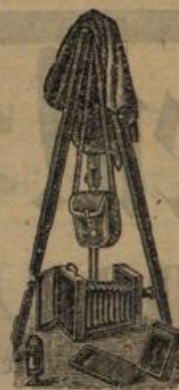
Anfänger erhalten prakt. Unterweisung. Dunkelzimmer unentgeltlich zur Disposition.

Druck und Verlag von Chr. Fr. Müller'schen Hofbuchhandlung, redigirt unter Verantwortlichkeit von Ludwig Riegel in Karlsruhe.