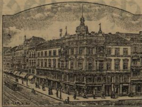
Kaiserstrasse Nr. 104, Herrenstrasse-Ecke.

* Frisir-Kämme, Scheitel-Kämme, Taschen- und Staub-Kämme, Nacken-Kämme, Selten-Kämme, Kinder-Kämme, Einsteck-Kämme, Kamm-Garnituren, Bürsten-Garnituren, Taschen-Bürsten, Kleider-Bürsten, Zahn-Bürsten, Nagel-Bürsten, Kopf-Bürsten, Kamm-Bürsten, Puder-Bürsten, Hut-Bürsten etc. *