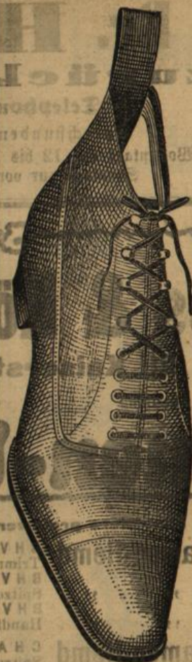
87 eigene Verkaufs-Niederlagen.

Alleinig concessionirter Fabrikant nach Originalpreisliste.