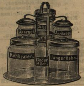
Für alle Zwecke.

Vollständige Apparate u. Geräte zur Frischhaltung aller Nahrungsmittel.