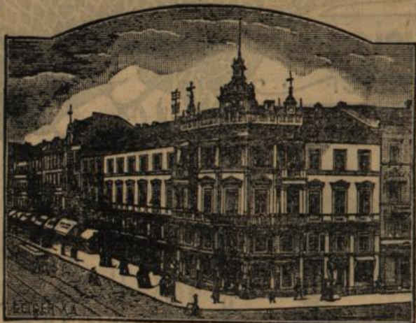
Kaiserstrasse 104, Ecke der Herrenstrasse.