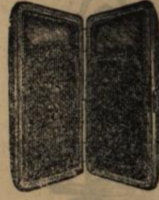
Schwedenständer-Feuerzeuge, Schwedische Zündholz-Etuis, Schwedische Zündhölzer, mittlere und grosse Form, Riesen-Zündhölzer, extra grosse Form.