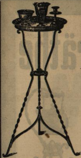
Aschen Becher = Aschen-Schalen verschiedene Formen und Ausführungen, Taschen-Feuerzeuge in Nickel, Bronze, Elfenbein u. s. w. Wachs-Zündhölzer, englisches u. italienisches Fabrikat.

in Zink — in Cuivre poli — in Kupfer — in Altsilber in Nickel u. Gold — in Schmiede-Eisen u. s. w.