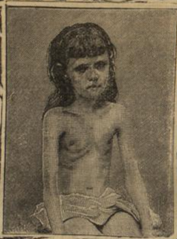
Vor der Sanatogen-Kur.

Sanatogen ist ein weisses Pulver, welches nach Verrühren in kaltem Wasser eingenommen wird. Es besteht aus Casein, dem Eiweissstoff der frischen Kuhmilch und dem wichtigsten Bestandteil der Gehirn- und Rückenmarksubstanz, der Glycerinphosphorsäure. Beide Substanzen wirken in ihrer Vereinigung zum Sanatogen ganz speciell ernährend auf das Nervensystem ein.