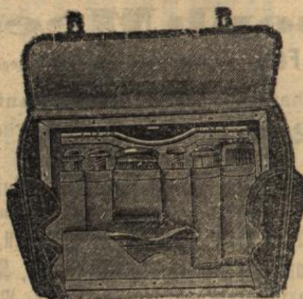
Reise-Säcke mit u. ohne Einrichtung, Photographie-Täschchen, Photographie-Kästchen,

Reise-Necessaire mit Einrichtung — Speise-Körbe — feines Korbgeflecht — für eine und mehr Personen, Portemonnaie — Börsen — Tresore, Geld- und Courier-Taschen, Hand- u. Reise-Taschen — Ridicule, Plaid-Riemen — Reise-Kleiderbügel, Reise- und Luft-Kissen, Sonnen- und Regenschirme, Spazier-Stöcke, Plaid-, Schirm- und Stock-Hüllen, Leder-Etui für Handschuhe, Kragen, Manschetten, Taschentücher etc., Reise- und Taschen-Apotheken, Reise Mützen und -Schuhe, Arbeits-Necessaire, Banknoten- und Brief-Taschen, Notiz-Bücher, Brief-Papiere und -Karten, Schreib-Mappen, Reise-Schreibzeuge, Cigarren- und Cigaretten-Etuis, Schwedische und Wachs-Zündhölzer, Feuerzeuge — Taschen-Messer, Reise-Leuchter — Fächer, Spiel-Karten u. Etuis dazu,