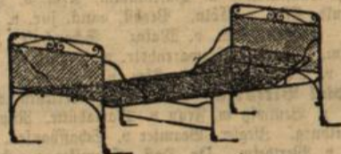
190/90, Mk. 11.50.