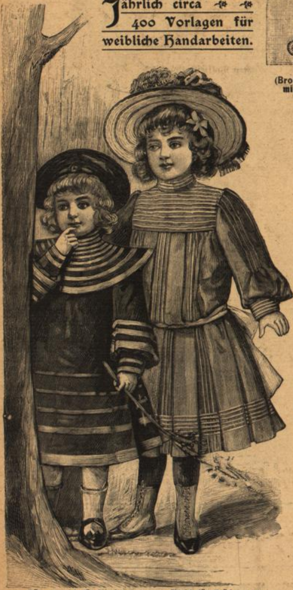
Hängerkleid für Kinder von 2-3 Jahren. Kleid für Mädchen von 4-6 Jahren. Schnitte in der „Sonntags-Zeitung für Deutschlands Frauen“.

Stickerei (Broderie lorraine) mit Eckbildung.