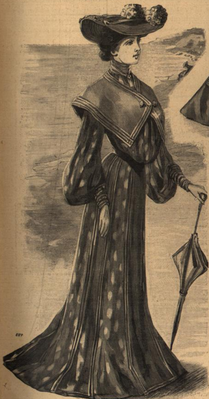
Strassentollette. Schnitt in der „Sonntags-Zeitung für Deutschlands Frauen“.