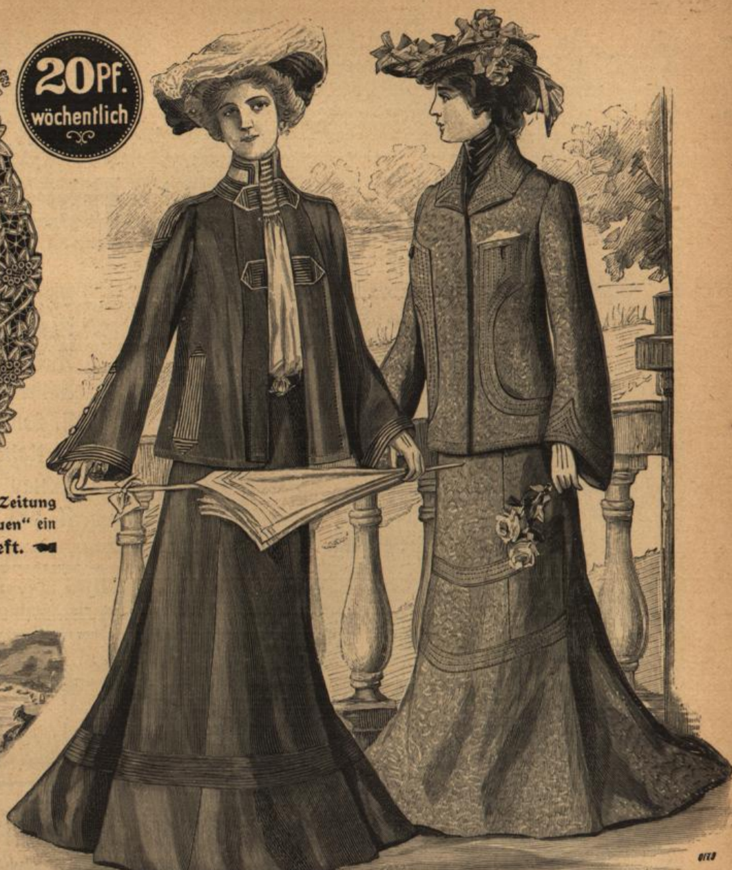
Jackenkleid. Schnitt in der „Sonntags-Zeitung für Deutschlands Frauen“.

Abwechselnd bringt die „Sonntags-Zeitung für Deutschlands Frauen“ ein Unterhaltungsheft und ein Modenheft.