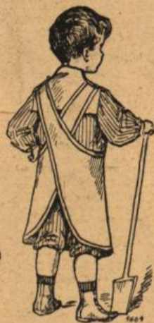
Spieleschürze für kleine Knaben.