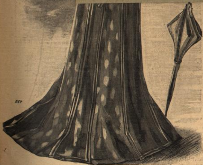
Strassentollette. Schnitt in der „Sonntags-Zeitung für Deutschlands Frauen“.

Den Namen bitte recht deutlich zu schreiben!