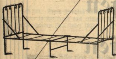
Bettstelle 190/90, braun, Mk. 4.70.