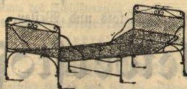
Bettstelle 190/90, bronziert, auf Rollen Mk. 10.20.