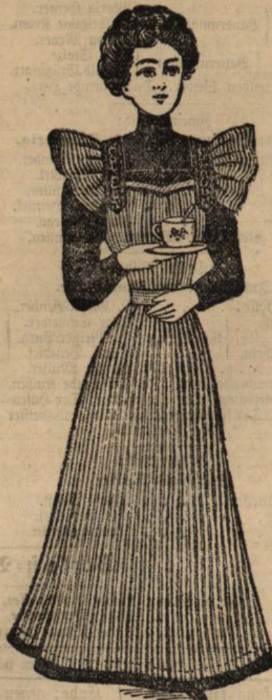
Träger-Schürze schwarz und farbig, von 95 Pfg. an.