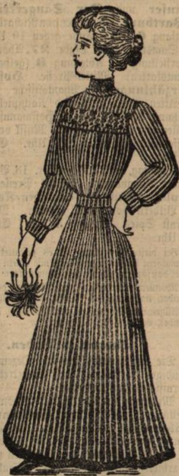
Kleider-Schürze von Mk. 3.50 an.