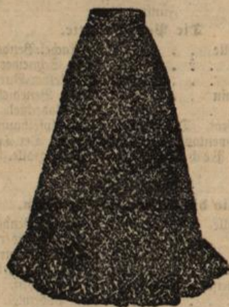
Haus-Schürze schwarz und farbig, von 75 Pfg. an.