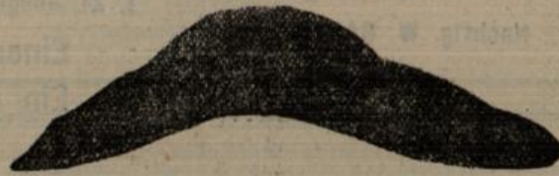
Goldene Medaille Hamburg 1903.

Die Feder ist aus prima Stahl her- gestellt, ist leicht u. elastisch. Ueber die- selbe ist eine Leder- einlage aus Kern- Vacheleder gear- beitet, die den Fuss umschliesst und ihn in seiner Lage fest- hält. Es ist dadurch der Fuss sowohl von unten wie seitlich gestützt.