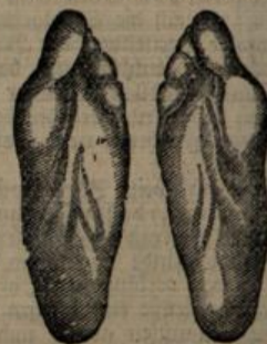
Erwachsene Füße bei Tragen beengenden Schuhwerks.

NB. Mache höfl. aufmerksam, daß meine seit einem Jahre mit größtem Erfolge eingeführten Reformschuhwaren bezüglich Eleganz und Passform weitgehendsten Anklang gefunden haben, und kann ich solche zur Wiederherstellung von Fußschäden nur empfehlen. Vom 1. April ab befindet sich mein Geschäft Erbprinzenstr. 2 (bisherige Räume der Konditorei Louis Desterle).