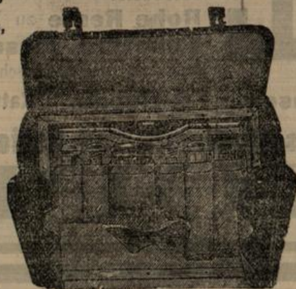
Reise-Säcke mit u. ohne Einrichtung, Photographie-Täschchen, Photographie-Kästchen,

Reise-Necessaire mit Einrichtung. — Speise-Körbe — feines Korbgewebe — für eine und mehr Personen. Portemonnaie — Börsen — Tresore, Geld- und Courier-Taschen, Hand- u. Reise-Taschen — Ridicules, Plaid-Riemen — Touristen-Ranzen, Reise- und Luft-Kissen, Sonnen- und Regen-Schirme, Spazier-Stöcke, Plaid-, Schirm- und Stock-Hüllen, Leder-Etuis für Handschuhe, Kragen, Manschetten, Taschentücher etc., Reise- und Taschen-Apotheken, Reise-Mützen und -Schuhe, Arbeits-Necessaire, Banknoten- und Brief-Taschen, Notiz-Bücher, Brief-Papiere und -Karten, Schreib-Mappen, Reise-Schreibzeuge, Cigarren- und Cigaretten-Etuis, Schwedische und Wachs-Zündhölzer, Feuerzeuge — Taschen-Messer, Reise-Leuchter — Fächer, Spiel-Karten u. Etuis dazu,