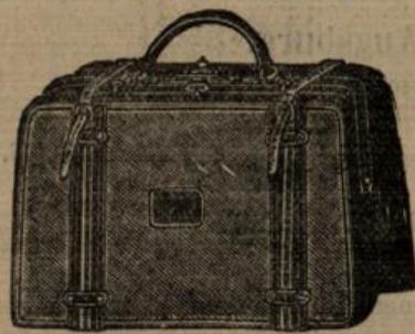
mit u. ohne Einrichtung

— in den besten Leder-Arten — 3.1. verschiedene Grössen grosse Auswahl in allen Preislagen bei