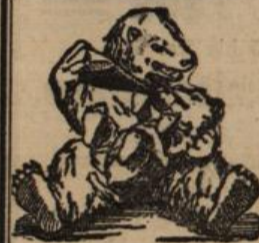
Bären - Marke.