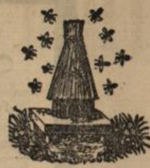
Marque de fabrique