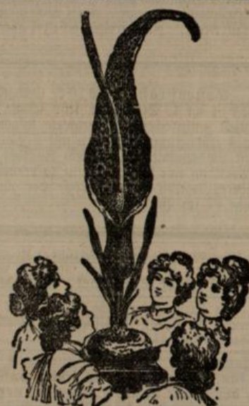
Sauromatum, Wunder der Blumenwelt, blüht ohne Topf, ohne Wasser, ohne Erde.

Ein Mustersortiment Blumenzwiebeln und Knollen für Töpfe ins Zimmer oder für den Garten, enthaltend Sauromatum, weisse Calla, Hyazinthen, 145 Narzissen, Crocus, schwarze Calla zusammen 100 Zwiebelknollen M. 2 85 zusammen 200 Zwiebelknollen M. 2 85 .