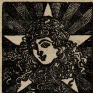
„Salem Aleikum“ Wert und Bild gesetzlich geschützt.