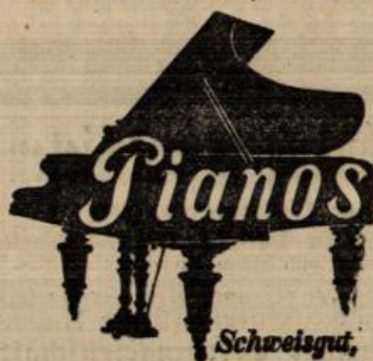
Schweisgut, Ueber Hundert Instrumente zur Auswahl.