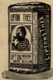
Verpackung in Packeten von \frac{1}{8} , \frac{1}{4} und \frac{1}{2} Kilo.

LIPTON TEE wird an KAISERLICHEN und KÖNIGLICHEN HÖFEN und von MILLIONEN von TEE TRINKERN als der FEINSTE und BILLIGSTE BEVORZUGT.