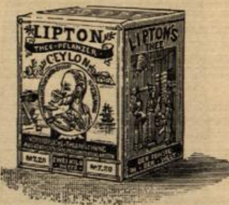
Verpackung in Blechdosen von 1 und 2 Kilo.

Daher 3mal so billig im Verbrauch, von feinstem Geschmack u. hoch aromatisch.