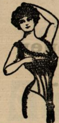
Wila 2.75 Mk. hellgeblümt Drell schönste Form für schlanke Figuren.