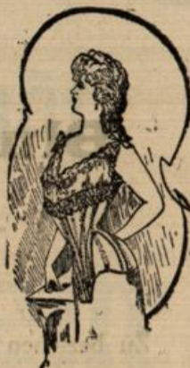
Etta 3.75 Mk. natur Drell mit Strumpfhaltern, für starke Damen sehr empfehlenswert.

Passendste Weihnachts- Geschenke, elegant-praktisch. Umtausch jederzeit gestattet.