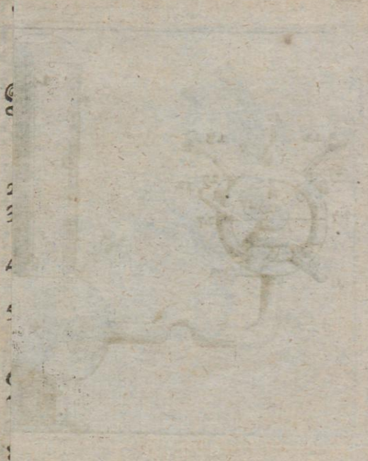
Abbildung oder Beschreibung