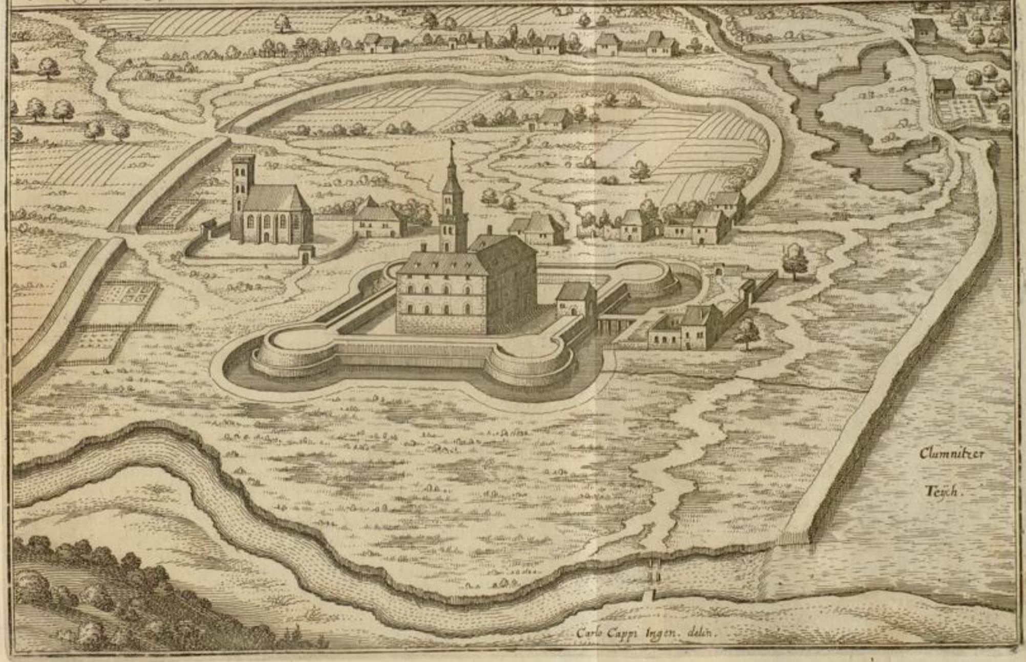
Das Schloß Chlumitz in Böhmen, welches die Kaiser den Schweden mit Gewalt abgenommen im Februario 1640.