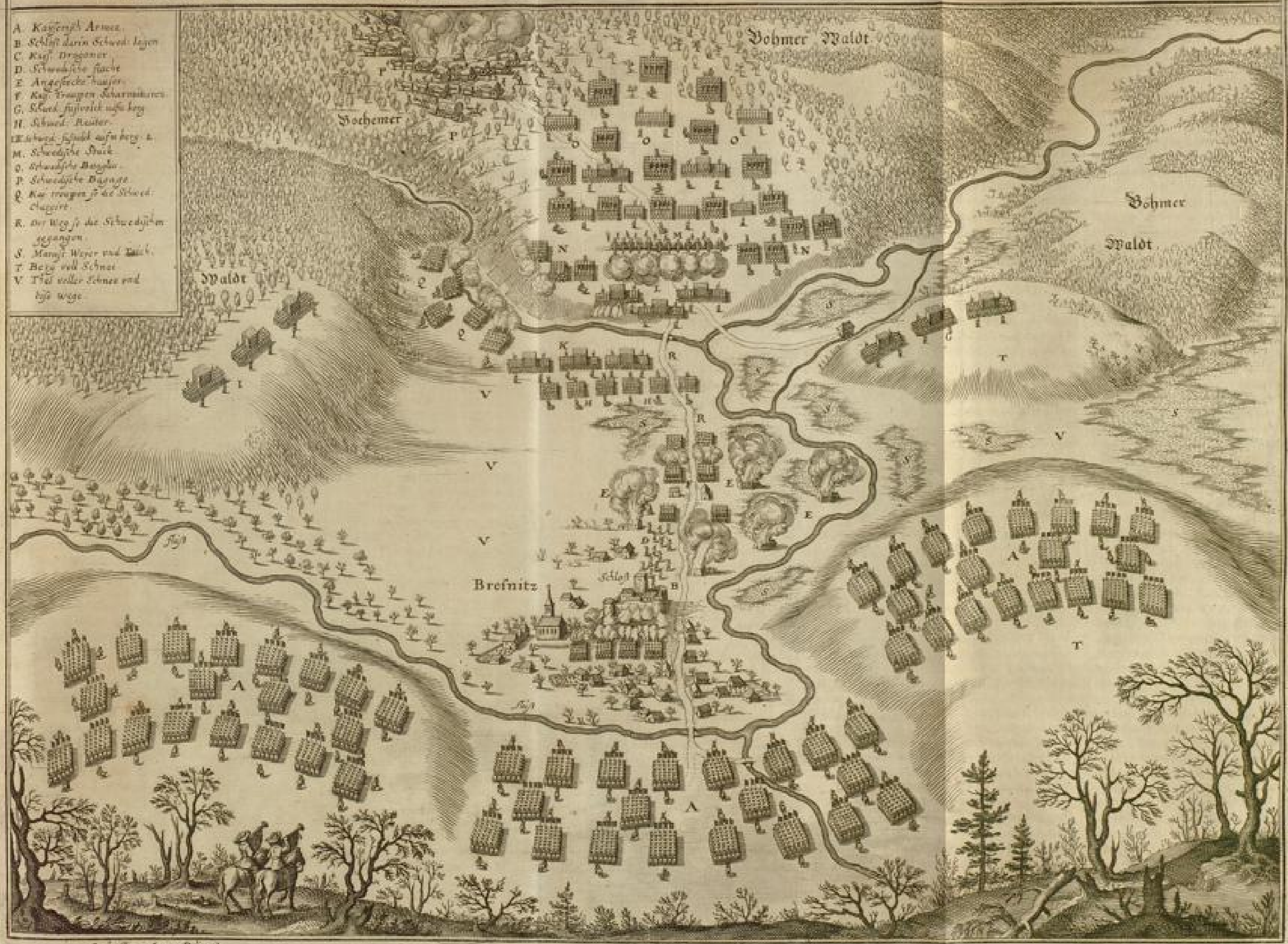
Carlo Capri Sculp. Delincent