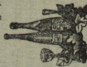
Gläserpreis 15 Pf. per Literflasche