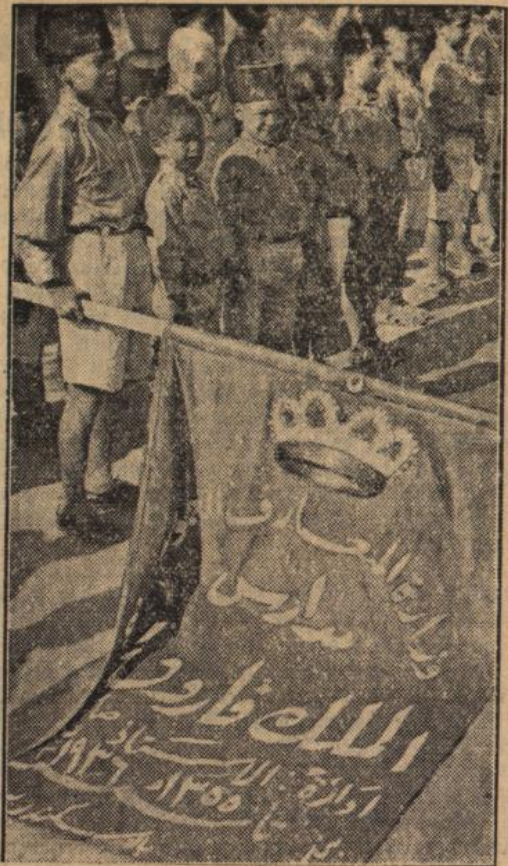
Ägypten grüßt König Faruk

Vom Baumarkt. Die Lage auf dem Baumarkt ist, was Auftragsbestand und vorliegende Bauaufgaben anlangt, als sehr günstig zu bezeichnen. Die verfügbare Menge an Baueisen befindet sich für einen wesentlichen Teil des Baumarktes den Umfang des Bauvolumens. Die Baukosten sind Mittel und Wege, trotz des Eisenmangels die Bauten durchzuführen, indem sie zur eisenarmen Bauweise übergeht und teilweise auf alte Baumethoden zurückgreift. Für die Industrie der Steine und Erden ergibt sich daraus die Folge, daß ein erhöhter Bedarf an Kieseln auftritt. Am Baumstoffmarkt zeigte sich anhaltend lebhafter Nachfrage. Vort-