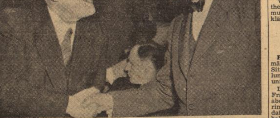
Warum nicht immer so? Herr Wyschinski (links), schüttelt Herr Cadogan als Privatmann mit freundlich lächelndem Gesicht die Hand.

Warren Austin ging auf die sowjetische Annexion eines Teils von Polen, Finnland und Rumänien, und die Einverleibung der drei baltischen Staaten ein und fragte, ob es wirklich noch notwendig sei, die Einzelheiten der Beherrschung der Balkanländer zu erörtern. „Die letzten Ereignisse, deren Einzelheiten eindrucksvoll genug sind, haben bewiesen, daß der Preis für die sowjetische Freundschaft die völlige Unterwerfung unter die sowjetische Politik ist.“ Warren Austin sagte im Verlauf seiner Ausführungen im Politischen Ausschuß anerkanntes Mittel betrachtet, um den Kommunismus auf der ganzen Welt durchzusetzen.