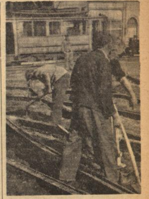
An der Hauptpost ist der Durchgangsverkehr seit Tagen gesperrt. Neue Geleise werden eingebaut und zur Verkehrstechnischen Verbesserung die Verkehrröhren entfernt.