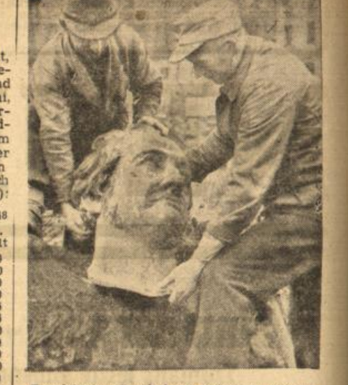
Frankfurter Goethekopf gefunden (Dena)