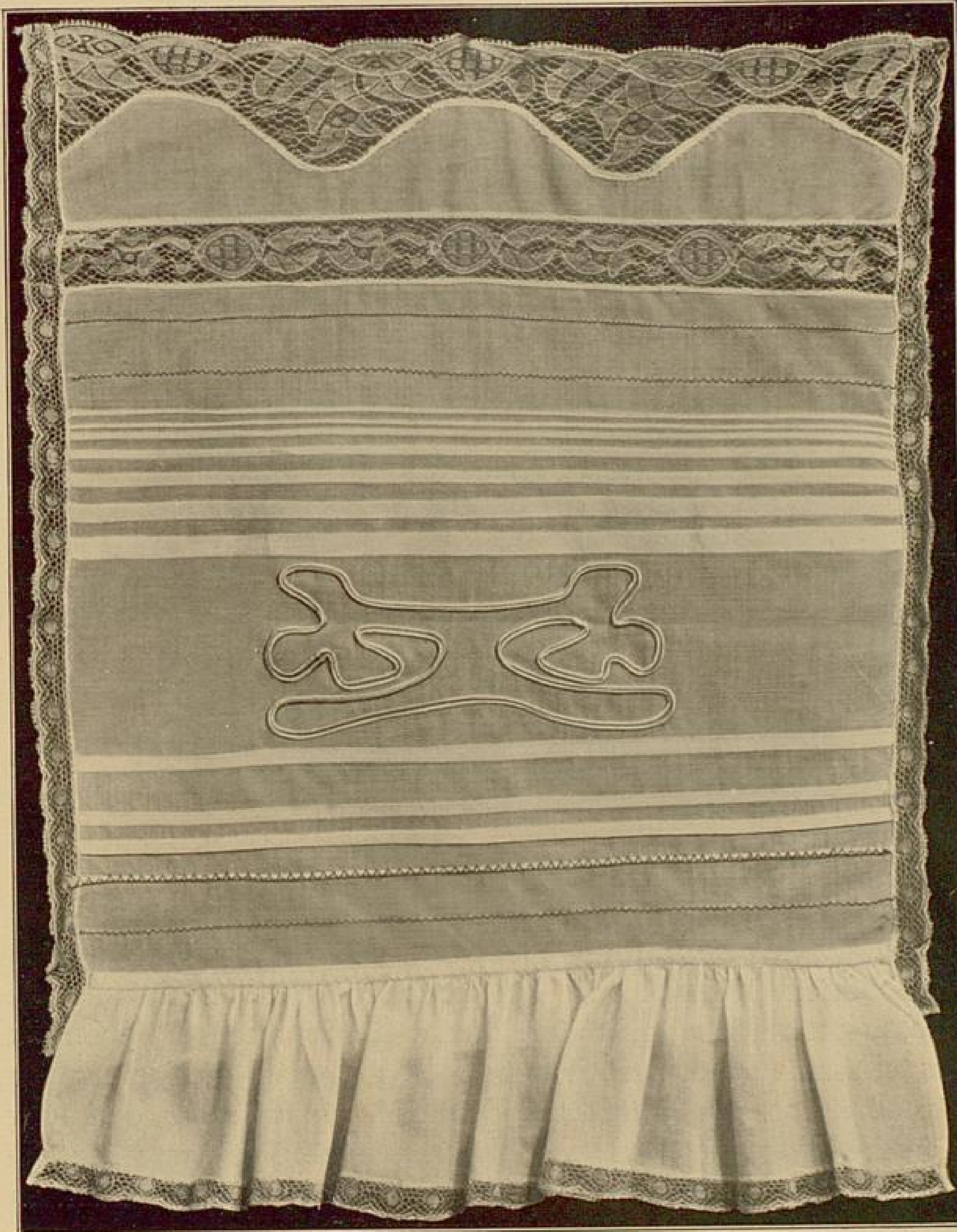
Abb. 24. Verschiedene Arbeiten.

Die Spitzen sind mit Hilfe des sogenannten Zickzack-Apparates aufgenäht, mit dem schöne Verzierungen an Wäsche und Kleidern angebracht werden können.