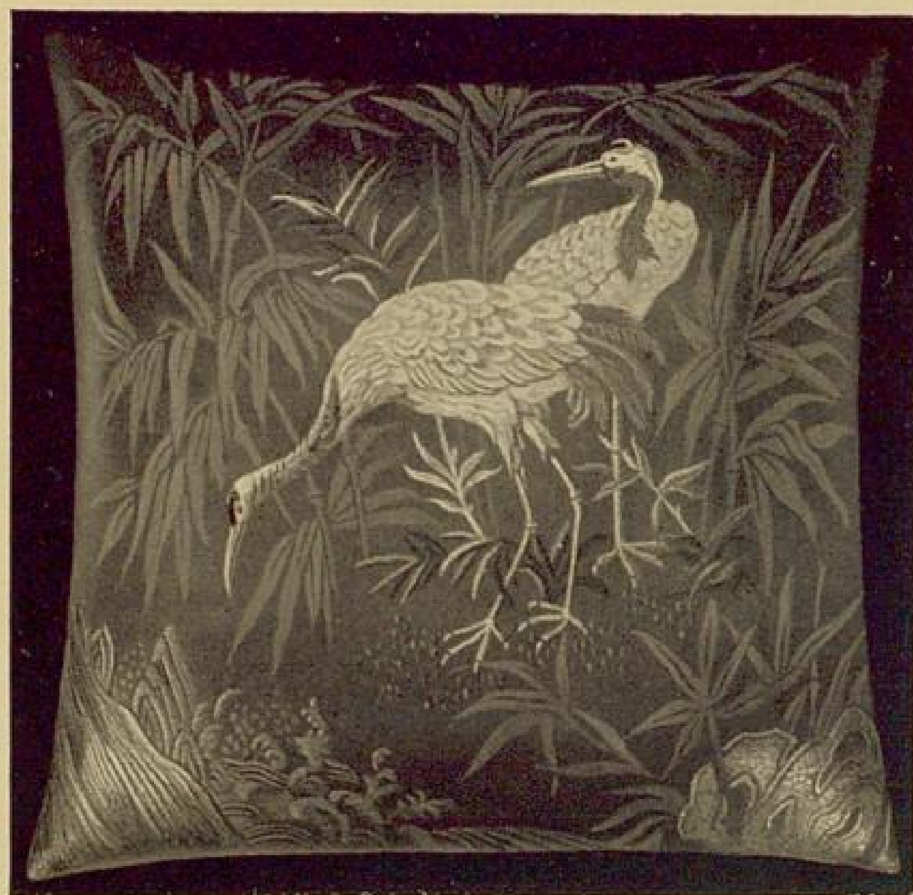
Abb. 25. Buntstickerei.

Die Kräuselung ist mit Hilfe des Kräuslers hergestellt, mit dem auf leichte Weise alle Arten von Kräuseln ausgeführt werden können.