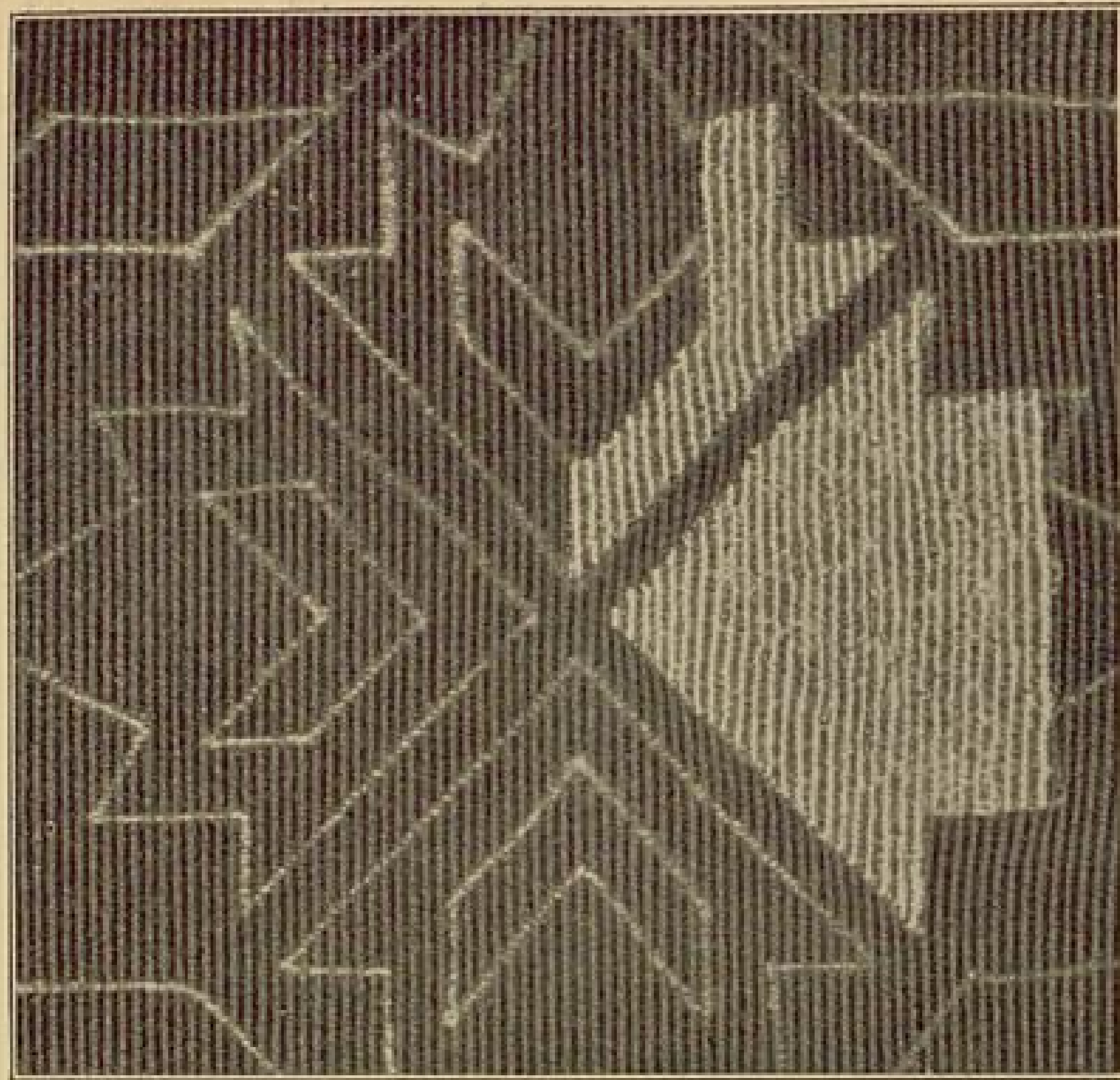
Abb. 22. Gobelinstickerei.