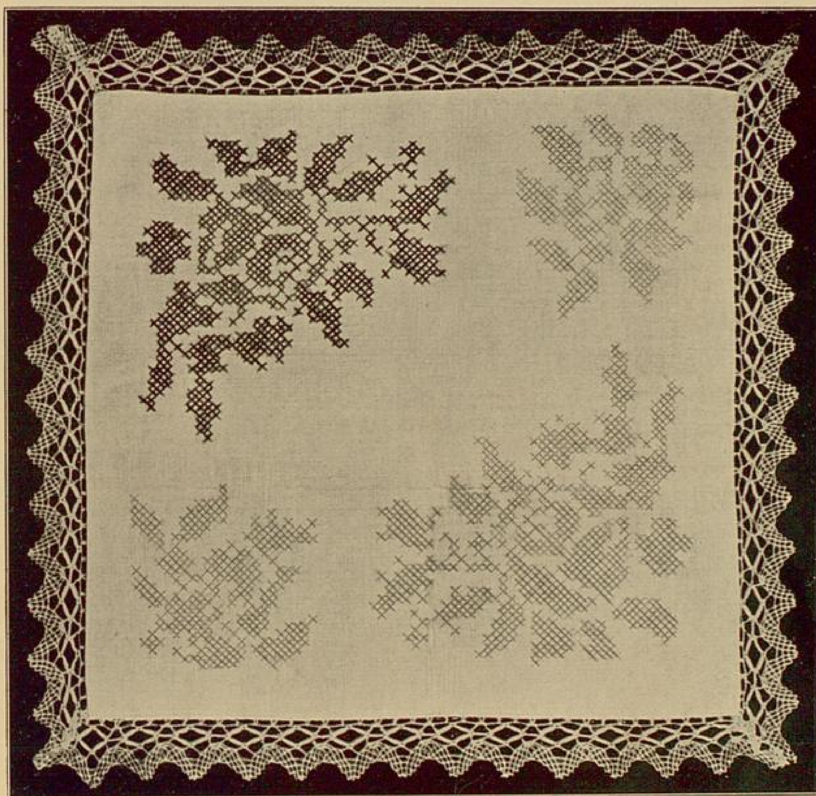
Abb. 21. Kreuzstich.

unterlegen, zu übersticken ist. Man zeichnet sich die Konturen der in einer Farbe zu bestickenden Fläche auf den Stoff, da die Arbeit nach Fadenabzählen zu mühsam wäre.