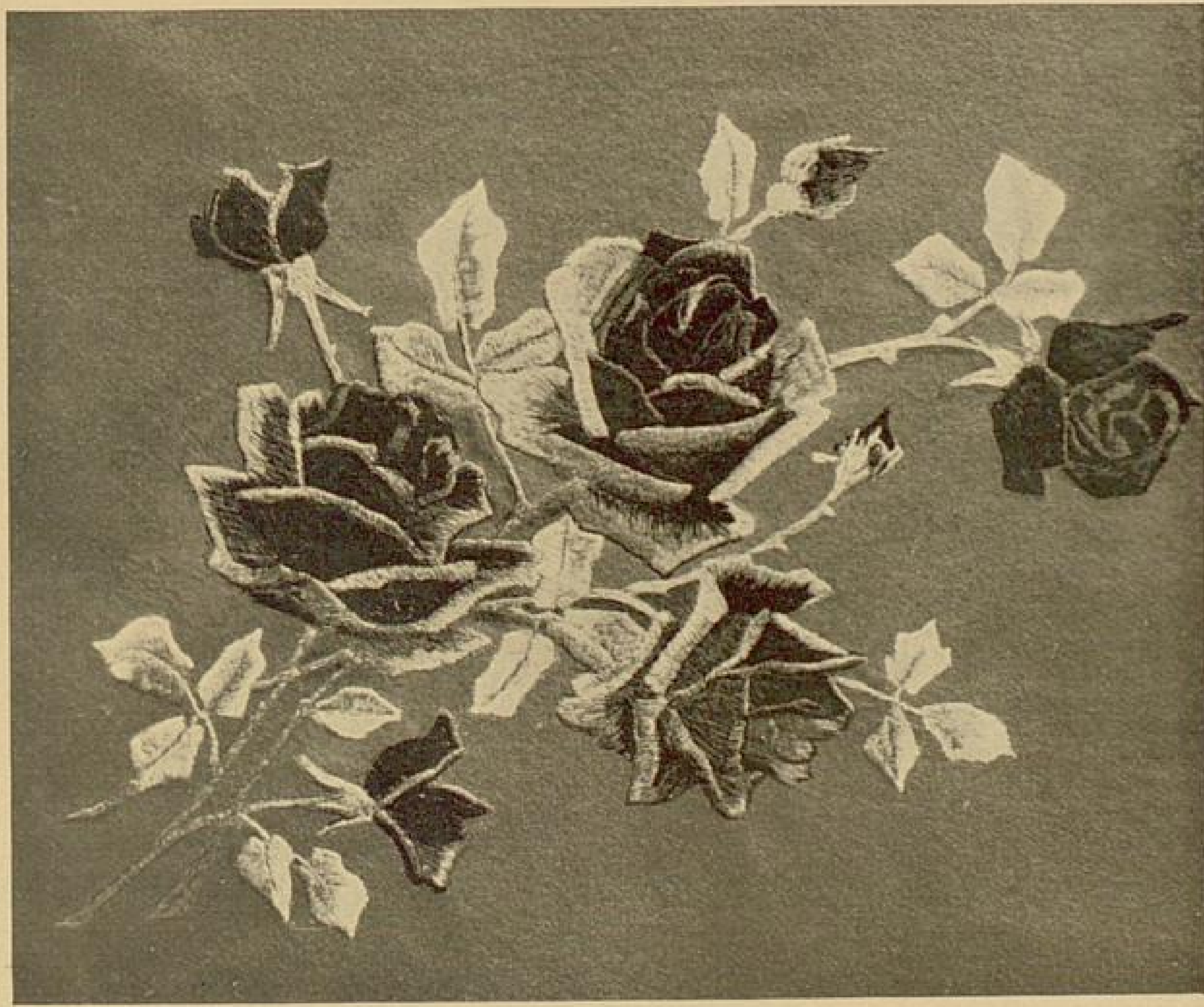
Abb. 16. Buntstickerei.