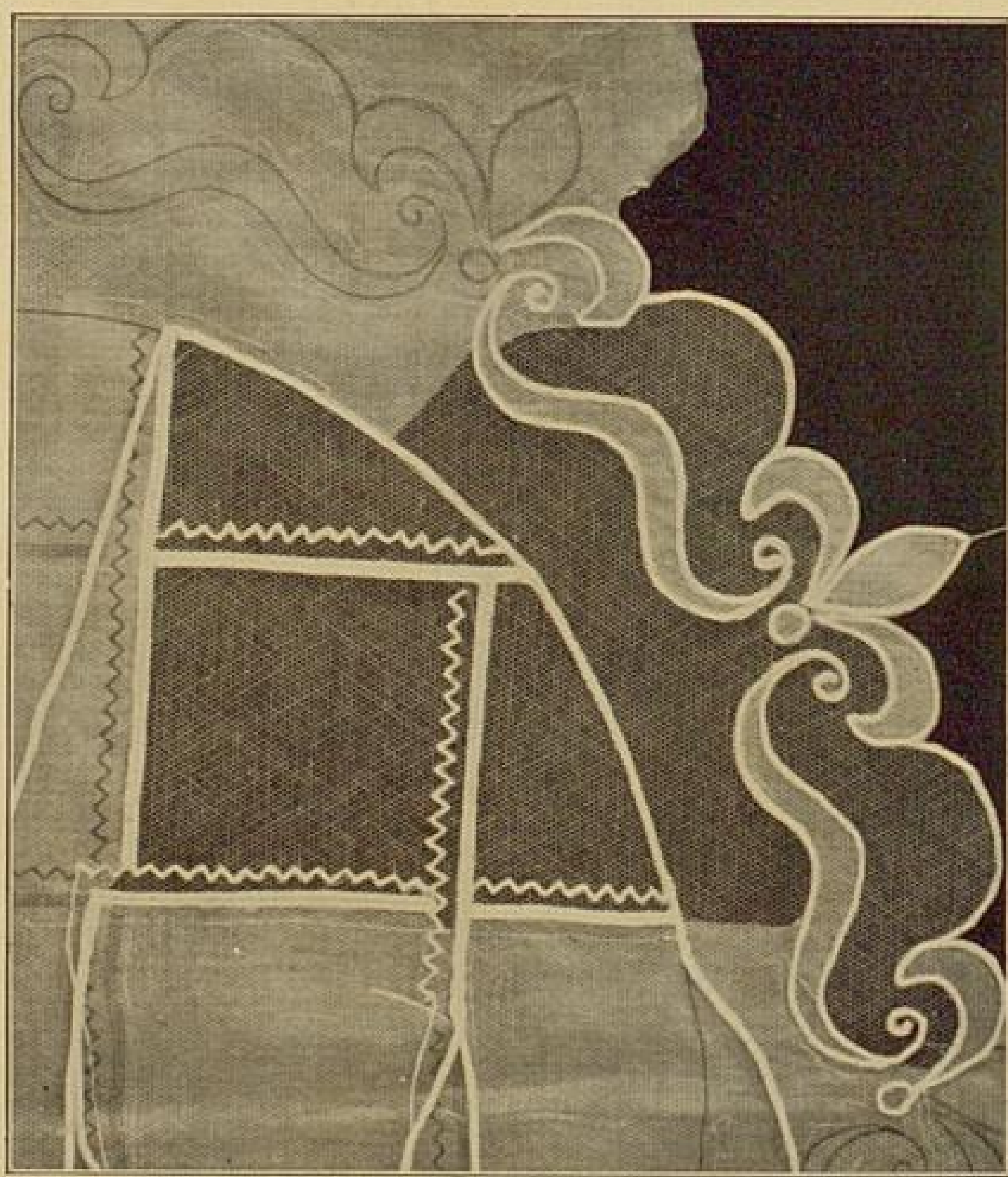
Abb. 18. Tüllapplikation.