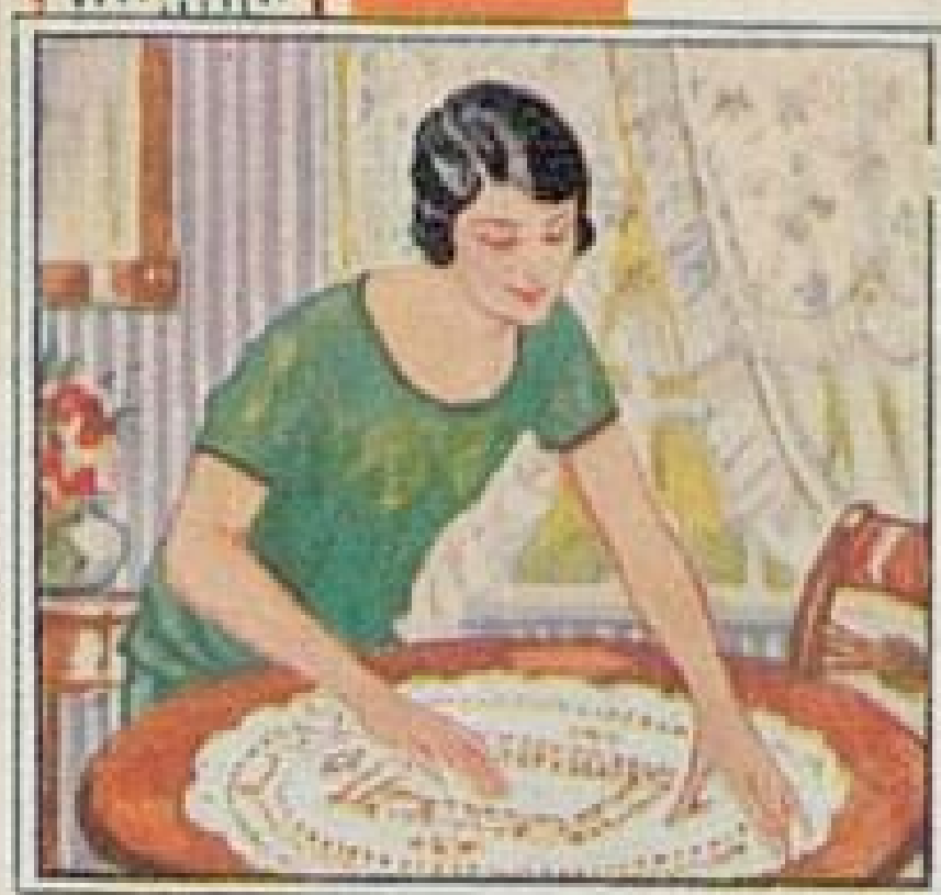
Lux Seifenflocken für feine Decken und alles Empfindliche.