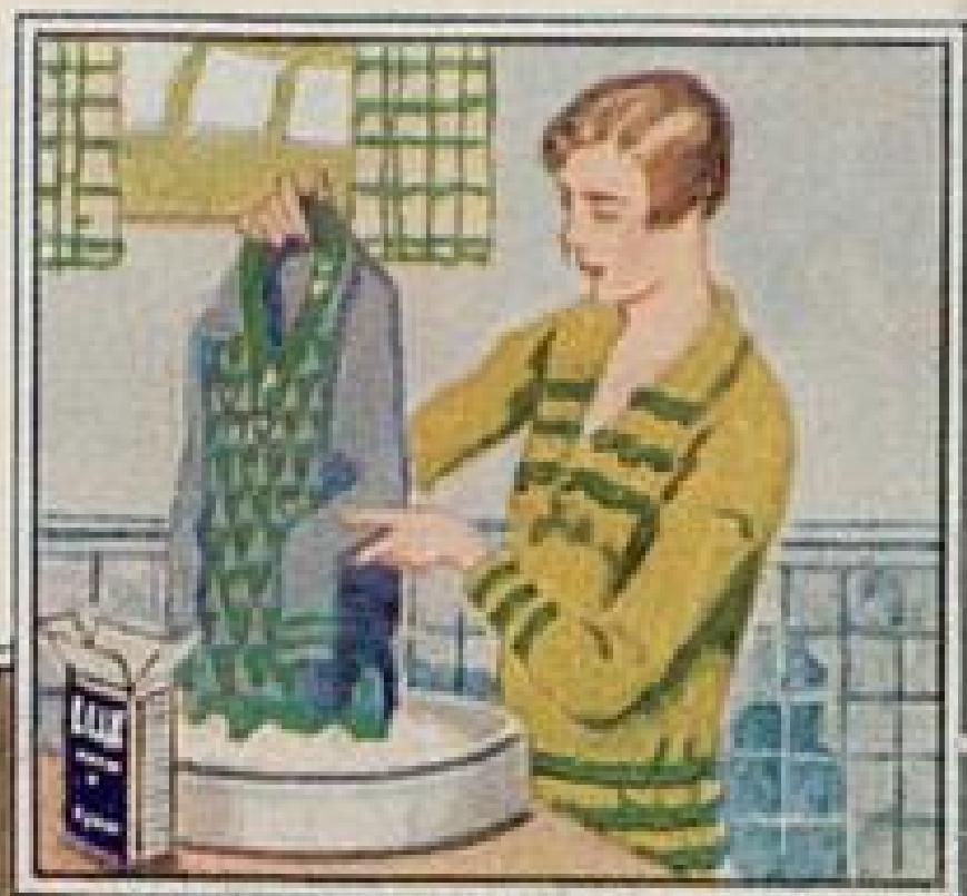
Mit Lux Seifenflocken bleibt Wolle weich und zart.

Zu Ihrem Schutz werden Lux Seifenflocken nur in Original-Packungen zu 50 und 90 Pfennig verkauft — nie lose.