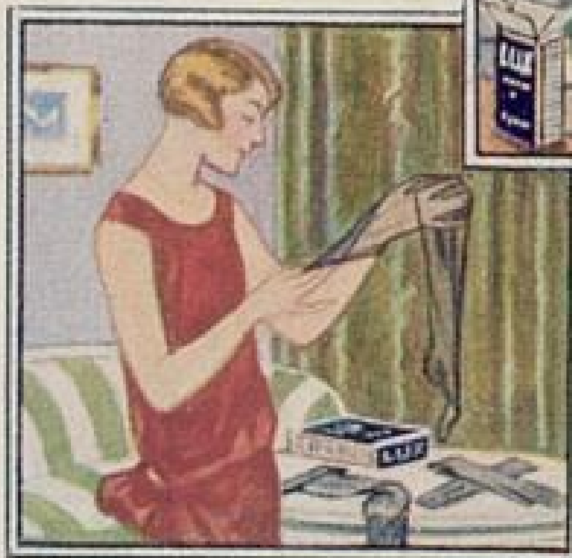
Kunstseide behält ihren schönen Glanz und weichen Seidengriff.

Um den wachsenden Feinwasch-Bedürfnissen zu genügen, haben wir die doppelgroße Packung geschaffen, die auch im Preis Vorteile bietet, — sie kostet nur 90 Pfg. Lux Seifenflocken sind kein Luxus, sie sind das denkbar sparsamste Waschmittel. Ein Eßlöffel voll genügt zur Reinigung von zwei Paar Seidenstrümpfen und jede doppelgroße Schachtel enthält 40 Eßlöffel voll.