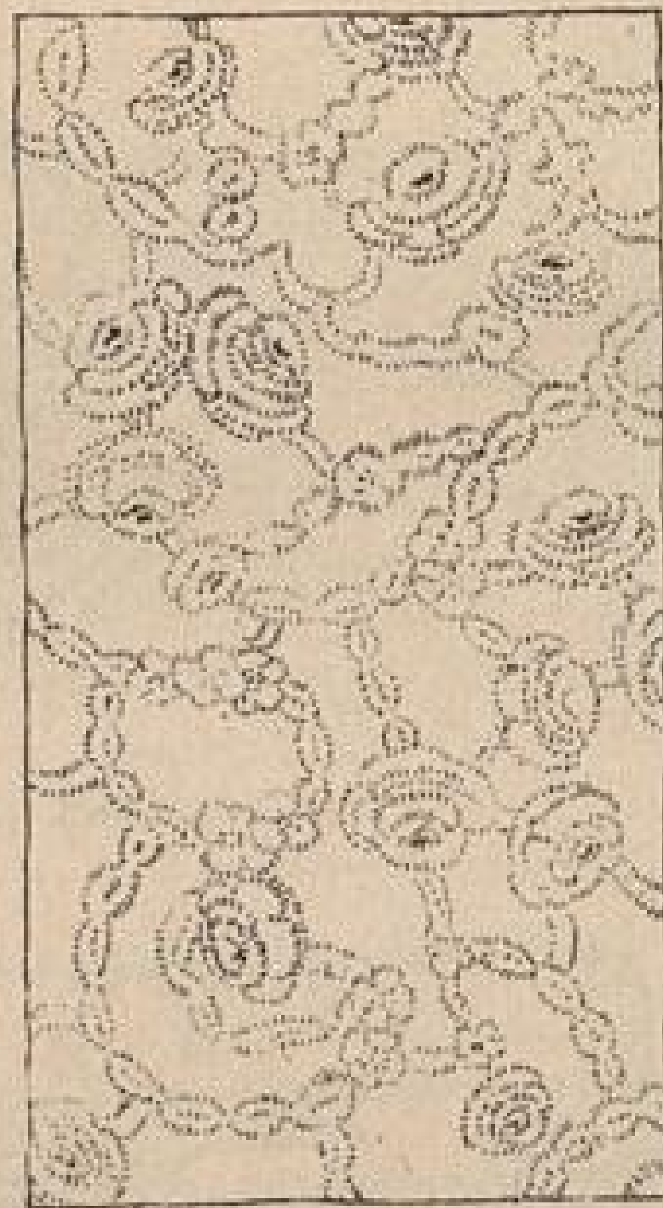
Abb. 3. Damast, bei dem die Musterung nach oben und nach unten läuft.