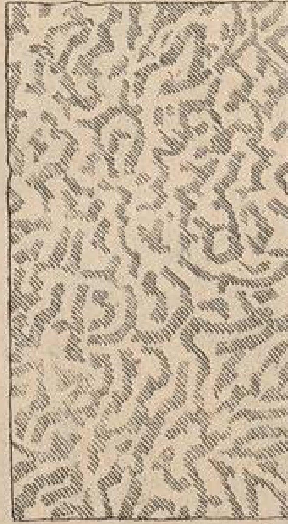
Abb. 4. Künstlerstoff, bei dem die Musterung nach oben und nach unten läuft.