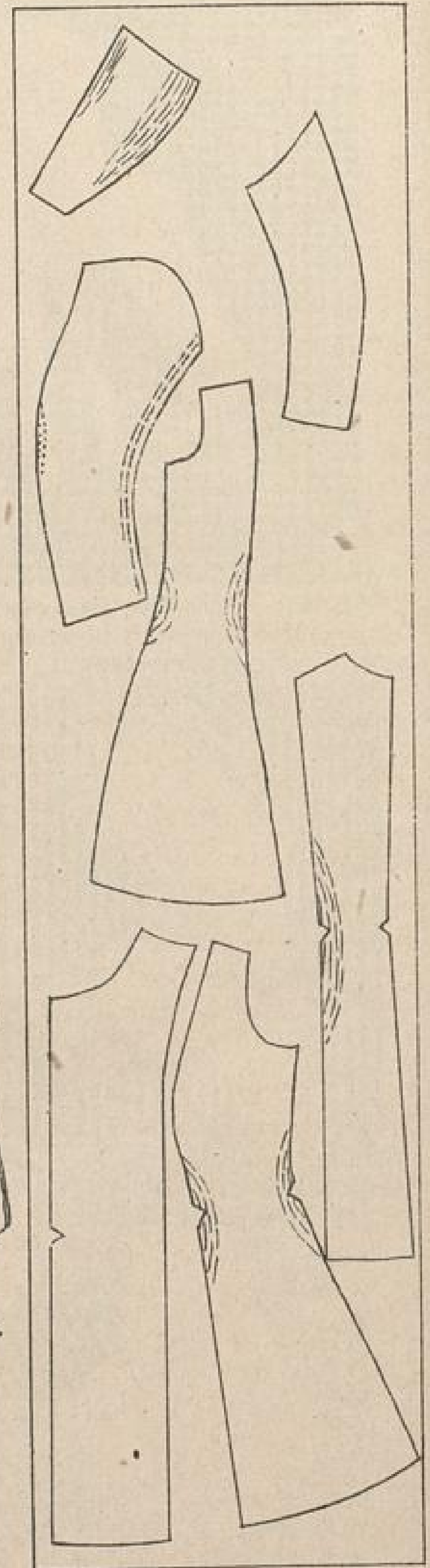
Abb. 45. Halbanschließende Jacke. Das Auflegen des Schnittes bei Strichstoff. Die mit Strichen versehenen Stellen werden beim Bügeln gedehnt. Die punktierte Stelle wird eingebügelt.