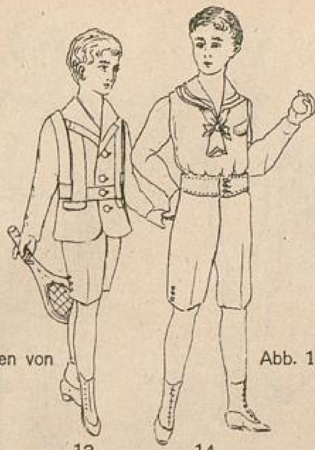
Abb. 13. Joppenanzug für Knaben von 8—10 Jahren.