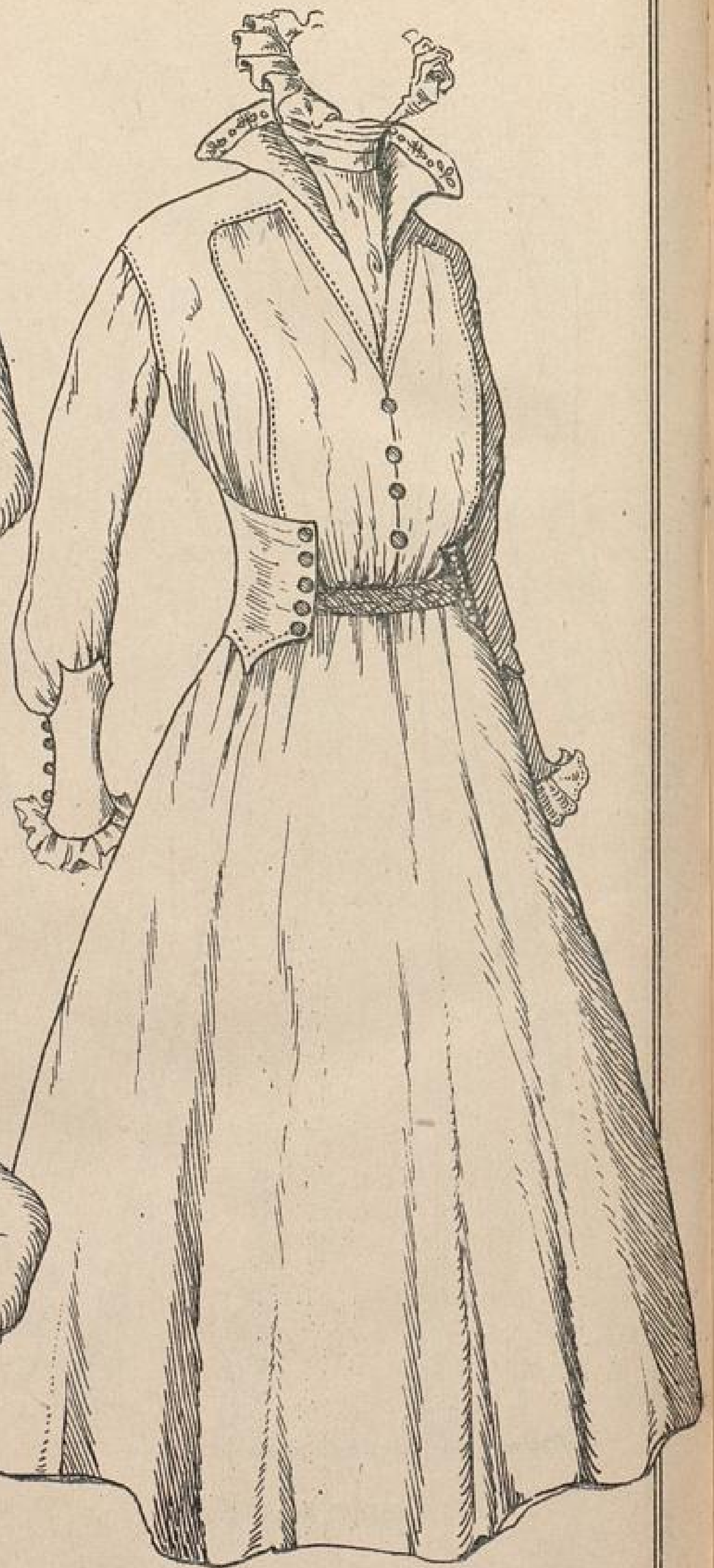
Abb. 7. Fertig skizziertes Kleid.