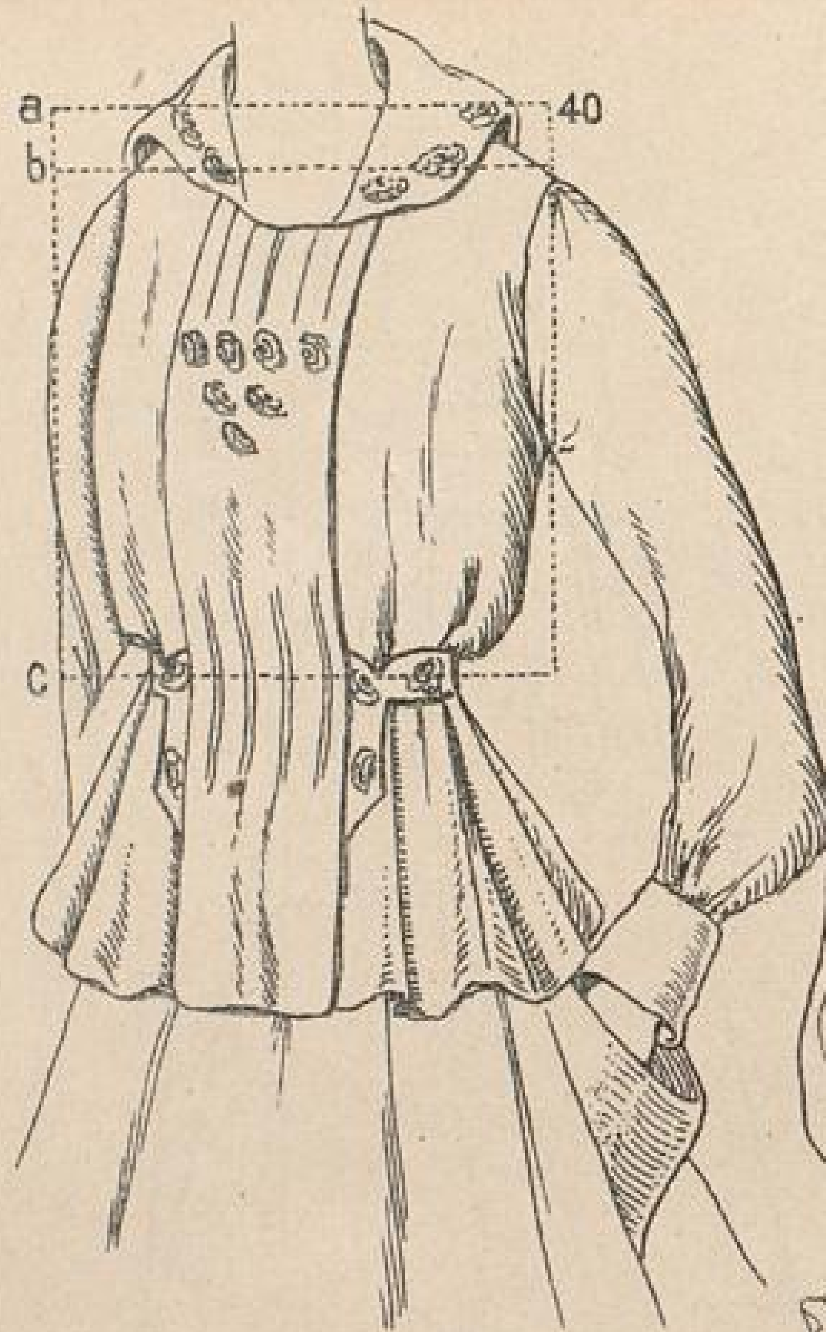
Abb. 5. Schoßbluse.