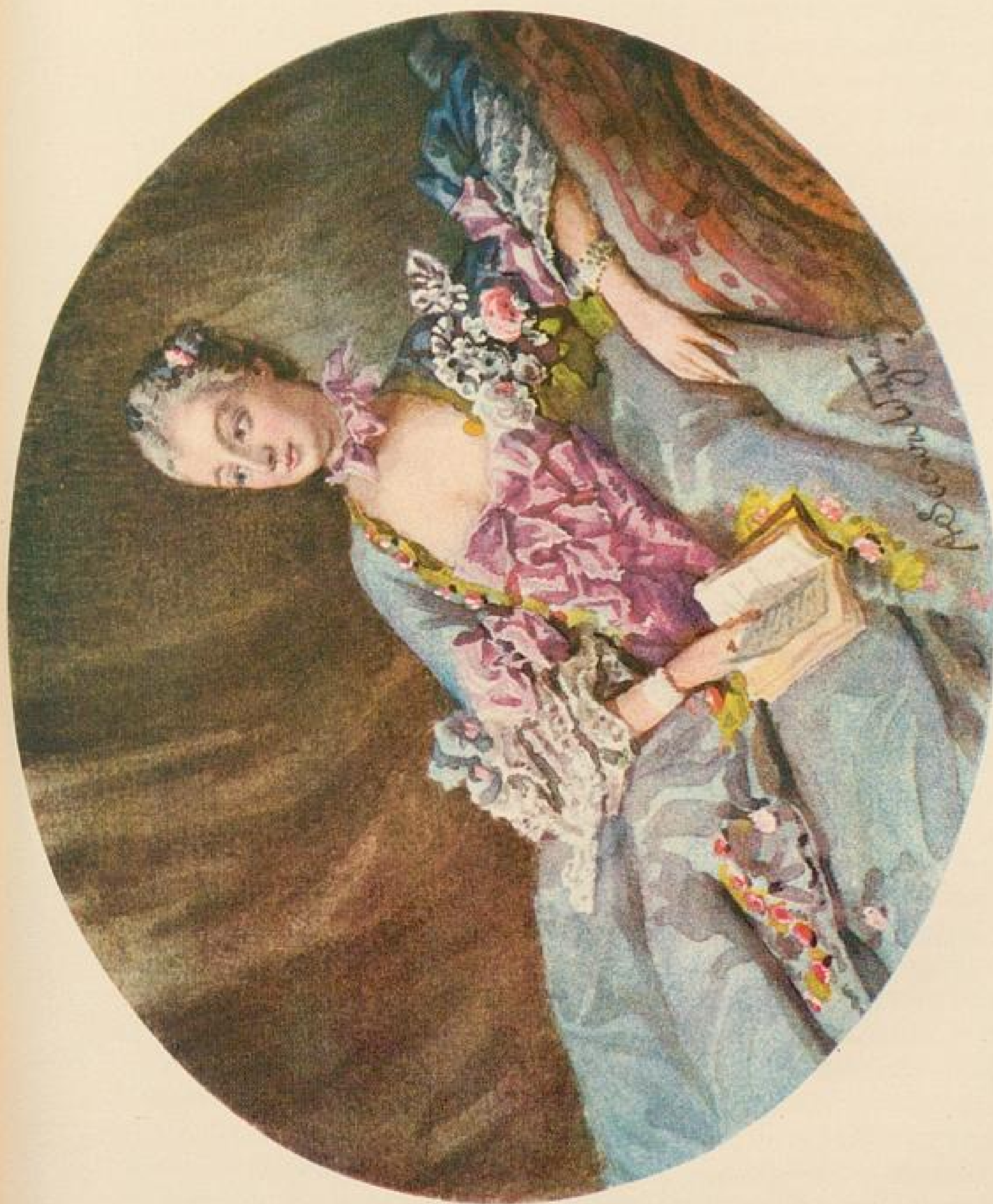
François Boucher, Madame de Pompadour (18. Jahrhundert).