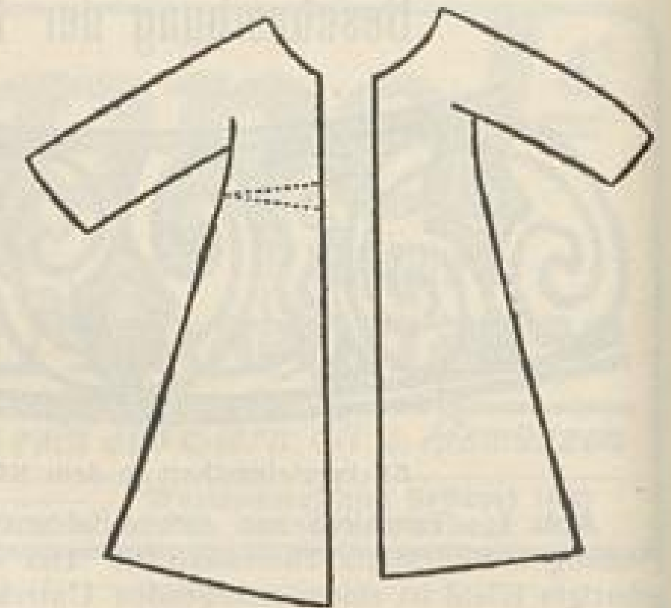
Hälfte des Rückenteils Hälfte des Vorderteils Schnittübersicht zu dem Idealkleid Abb. IX.