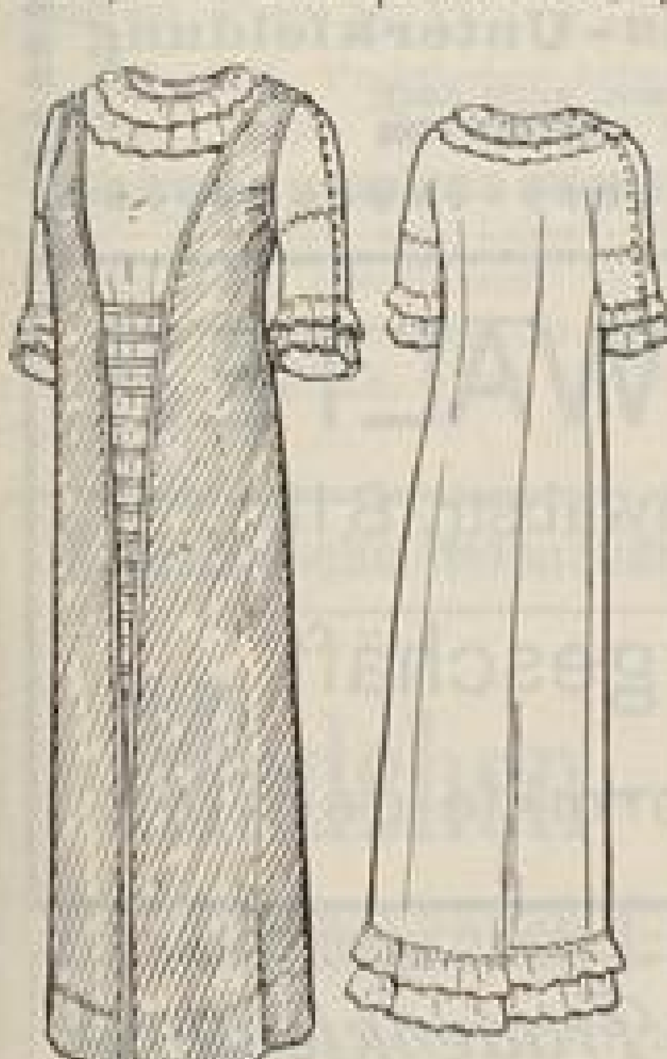
Überkleid zu Abb. VI. Unterkleid zu Abb. VI.