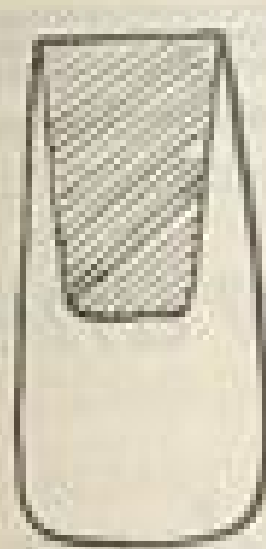
Waschbare Tasche Zu dem Artikel »Taschen« Seite 92.

Abb. I und II. Gesellschaftskleid aus gelbem China- krepp von Marie Pose, München, Theresienstr. 19 III. Geraffter Rock aus Vorder- und Rückbahn bestehend. Die Vorderbahn ist in der Mitte als tiefe Falte, und seitlich unter dem überleitenden Rückteil gleichseitig ge- rafft. Das Rückteil, in eine Schleppe endigend, ist seitlich glatt aufgesetzt und bildet in der Mitte durch Gegeneinanderliegen des Stoffes Raffung und schönen Faltenwurf. Die Vorderteile der Taille kreuzen sich, sie sind sichelartig mit einer Schleife über das in ein Schoßteil mit eingeknüpfter Franze endigende Tailen- rückteil gebunden. Der eigenartige Ärmel, aus einem Stück bestehend, legt sich, aus einem Ausschnitt heraus-